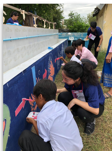
文藻外語大學師生完成洗手台彩繪